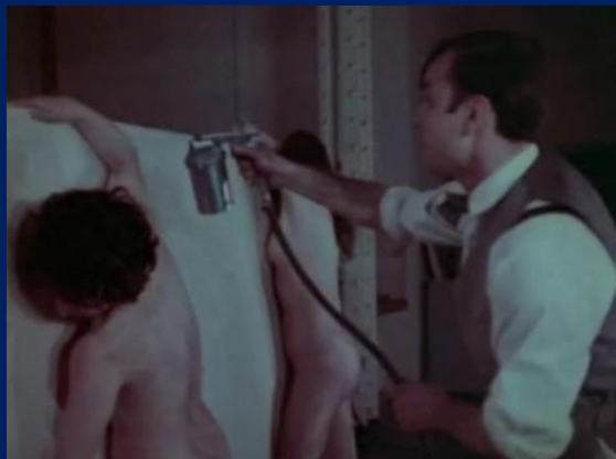
La Technique de la réalisation de l'œuvre HIROSHIMA

- Dans un second temps, il est à noter combien l'œuvre est importante dans sa place intermédiaire entre figuration et abstraction. En effet le grand format et la monochromie rappelle la peinture abstraite américaine de l'époque ( Jackson Pollock, Barnett Newman ). Cependant Yves Klein est un membre fondateur du mouvement français nommé Nouveau Réalisme . Ce mouvement s'oppose justement à la peinture abstraite, pour un retour à la réalité, tout en restant avant-gardiste . La plupart des nouveaux-réalistes travailleront à partir d'objets quotidiens. Dans l'œuvre « Hiroshima » l'élément emprunté au réel est le corps, qui devient un outil de peinture (femmes pinceaux). Il ne faut pas non plus oublier les conditions de réalisations de l'œuvre. En effet, les Anthropométries sont toujours réalisées lors de performances . Toute une mise en scène est organisée pour aboutir à l'œuvre. Le moment, le geste sont tout aussi importants si ce n'est plus que le résultat peint.